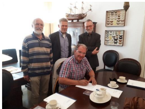
Figuur 1 - Het oprichtingsbestuur