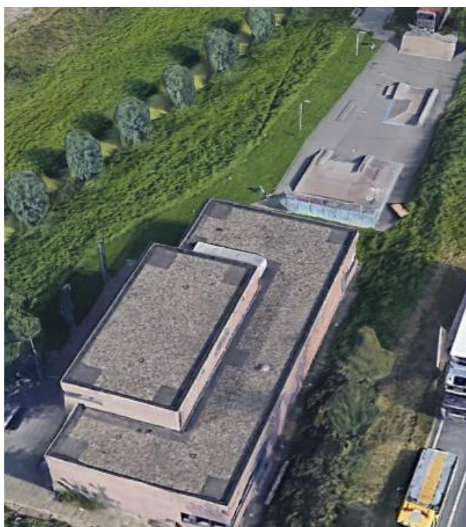
Figuur 3 - Bovenaanzicht 't Blok